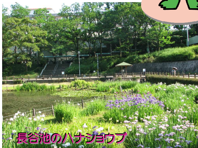
長谷池のハナショウブ