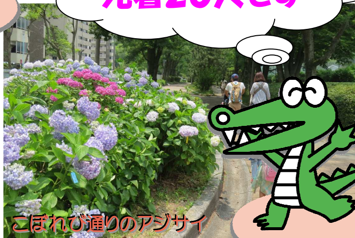
こぼれび通りのアジサイ