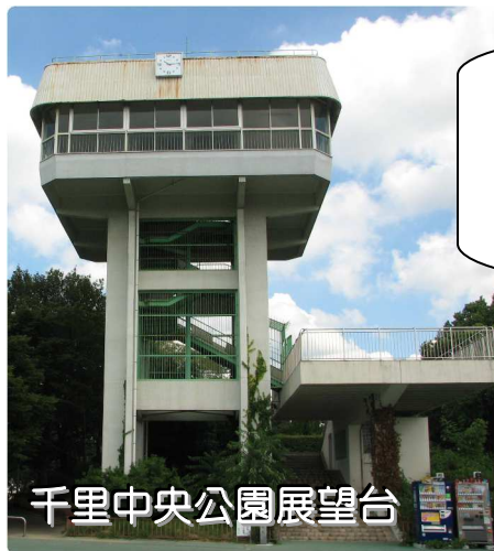
千里中央公園展望台